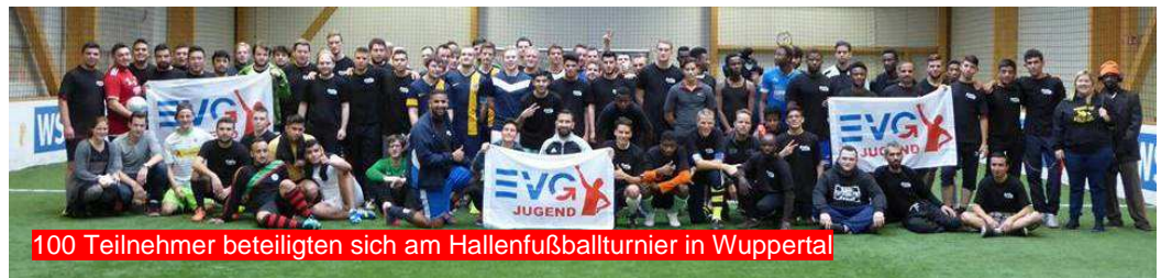
100 Teilnehmer beteiligten sich am Hallenfußballturnier in Wuppertal