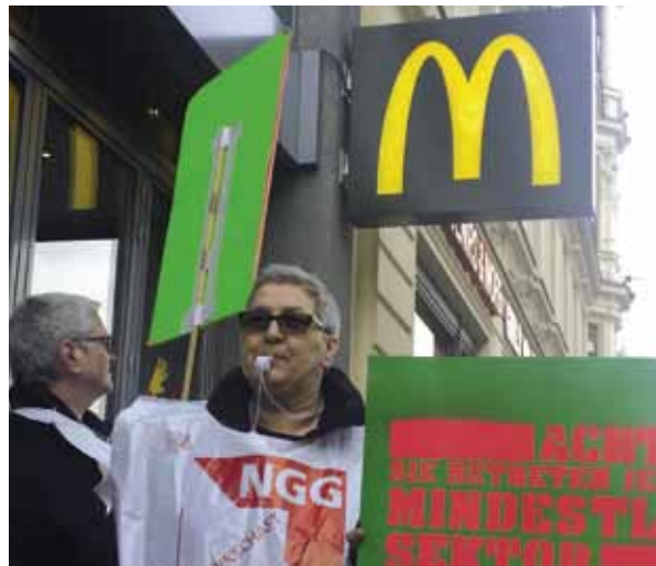
Tarifrunde Systemgastronomie: 8.3.2017, Warnstreik am Checkpoint Charlie

In Berlin und vielen anderen Großstädten müssen immer mehr Menschen ihre Kieze verlassen. Sie finden keinen bezahlbaren Wohnraum mehr. Deswegen brauchen wir Investitionen in unsere Infrastruktur und in die öffentliche Daseinsvorsorge. Dazu gehört mehr sozialer Wohnraum ebenso wie öffentliche Gebäude wie Schulen zu sanieren und technisch zukunftsgerecht auszustatten. Öffentliche Infrastruktur heißt aber auch in Köpfe investieren. Wir brauchen mehr Personal im öffentlichen Dienst. Es gibt viel, was wir für ein Leben ohne Abstiegsängste tun können und müssen. Es gibt viel, was wir als Gewerkschaften für eine sozial gerechtere Gesellschaft und mehr Zusammenhalt tun können. Darum nutzt den 1. Mai als unseren Tag der Gewerkschaften! Beteiligt euch am 1. Mai!