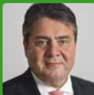
Sigmar Gabriel Bundeswirtschafts- minister, MdB