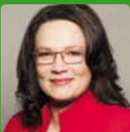
Andrea Nahles Bundesarbeits- ministerin, MdB