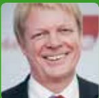
Reiner Hoffmann Vorsitzender des DGB