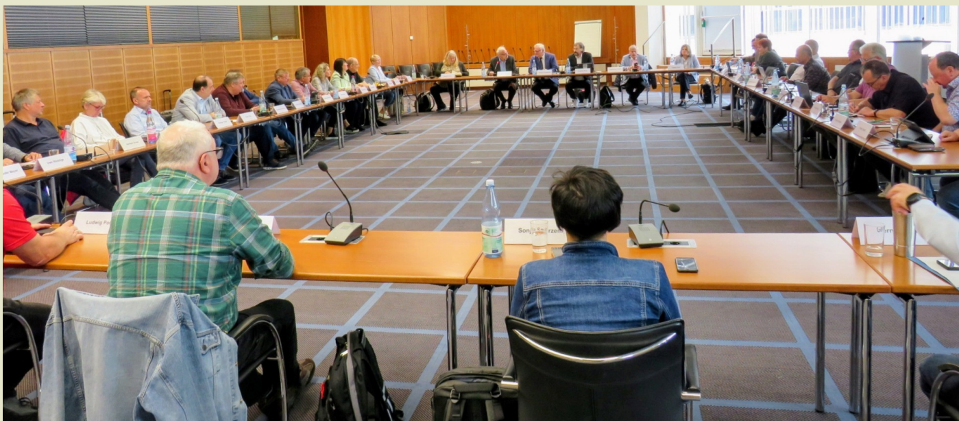
Plenum und Gäste beim Monatsgespräch des BesHPR in Bonn