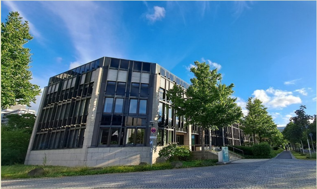
Hauptverwaltung des BEV in Bonn

Zu unserer 23. Plenarsitzung am 10.06.2026 in Bonn