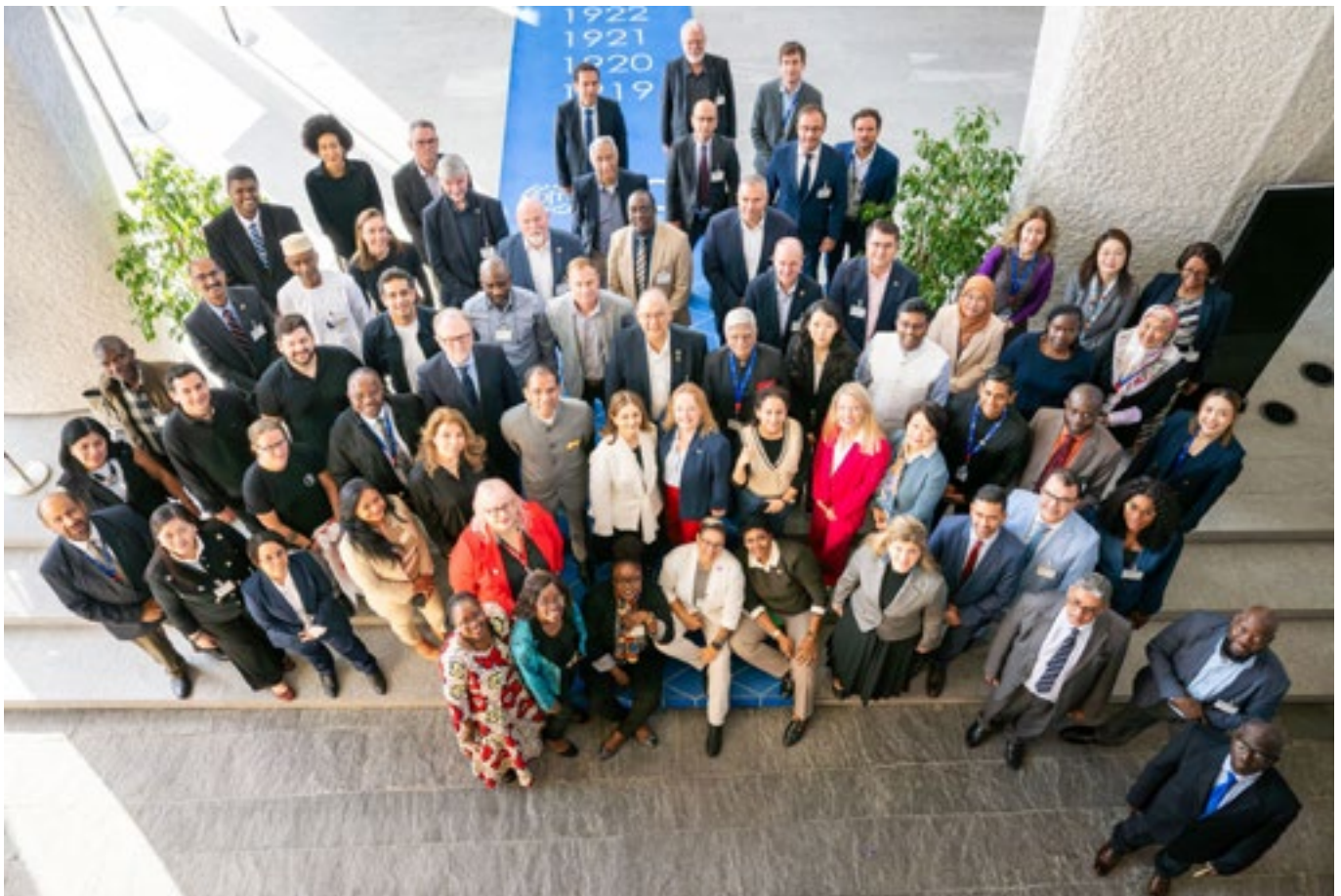
Die IAO-Tagung im Oktober 2025

Wenn es darum geht, die Zukunft des Bahnsektors zu gestalten, ist der soziale Dialog zwischen Gewerkschaften, Arbeitgebern und Regierungen von entscheidender Bedeutung. Bei Themen wie der Einführung neuer Technologien, Klimaschutz und einem gerechten Übergang, Arbeitsorganisation und Kompetenzstrategien müssen die Beschäftigten im Mittelpunkt des Entscheidungsprozesses stehen.