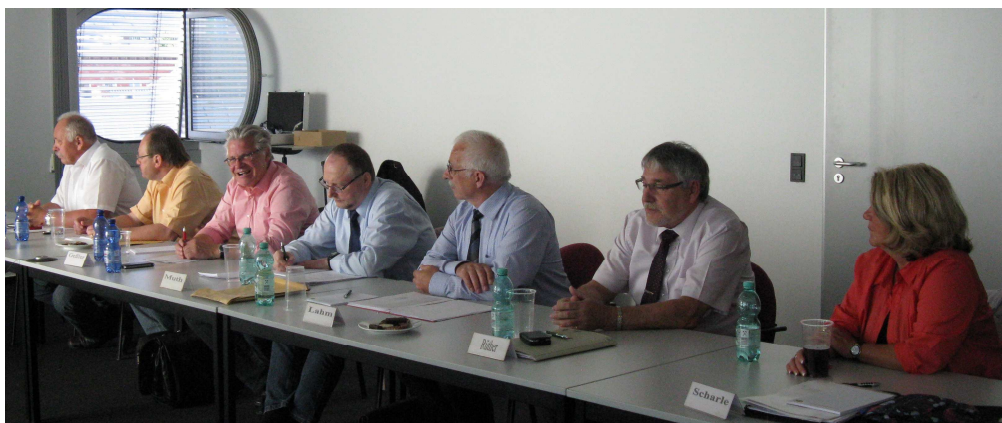
Plenumsmitglieder in der Sitzung

Die Vorbereitungen beim BEV laufen. Im Juli 2014 werden die Abschlagszahlungen auf die Erhöhungsbeträge für den Zahlmonat August 2014 (rückwirkend ab 01.03.2014) eingestellt.