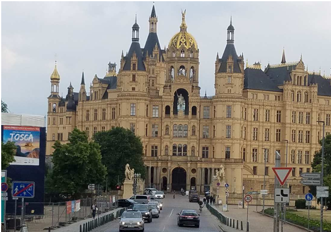
Noch ein paar Bilder aus der schönen Stadt Schwerin