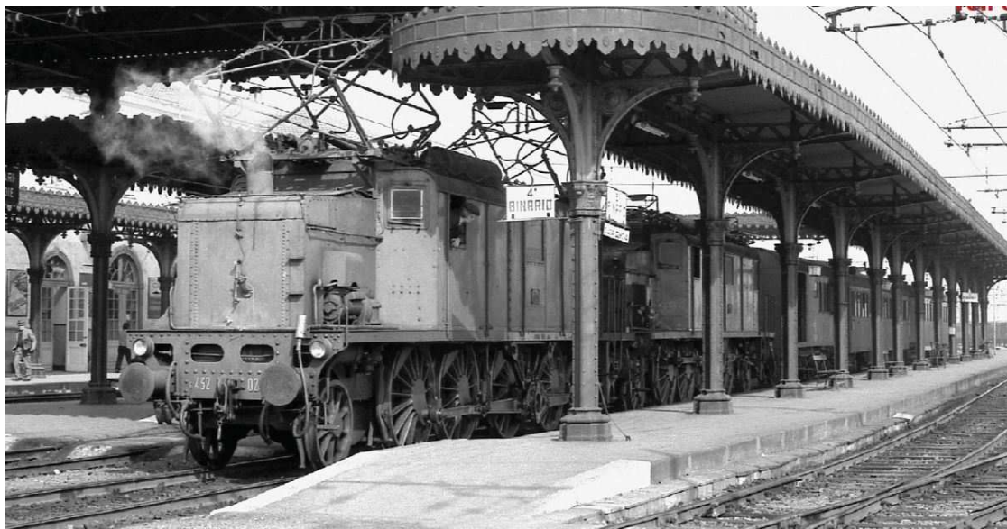
Die dampfende E.432.025 zusammen mit der E.432.030 vor einem Personenzug am 26. März 1976 in Acqui Terme. (Franco Dell'Amico)