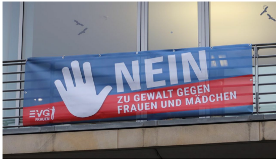
Banner an der EVG-Zentrale Berlin