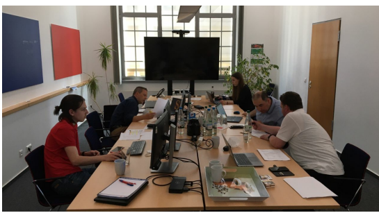
Kolleginnen und Kollegen bei der Wahlanalyse

Wir sagen ein herzliches Dankeschön an alle engagierten Kandidatinnen und Kandidaten. Ein herzlicher Dank aber auch an alle Wählerinnen und Wähler. Vor uns liegen spannende vier Jahre. Die damit verbundenen Herausforderungen werden wir gemeinsam bewältigen.